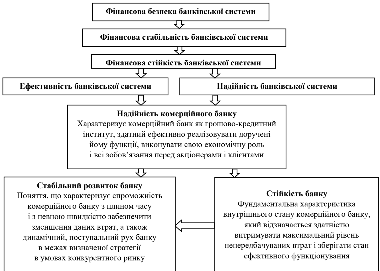
Рисунок 1 – Взаємозв'язок ознак, що характеризують фінансову безпеку, стабільність і стійкість банківської системи

непередбачуваних витрат, а також мінімізації збитків із подальшим дотриманням визначеної стратегії банку.