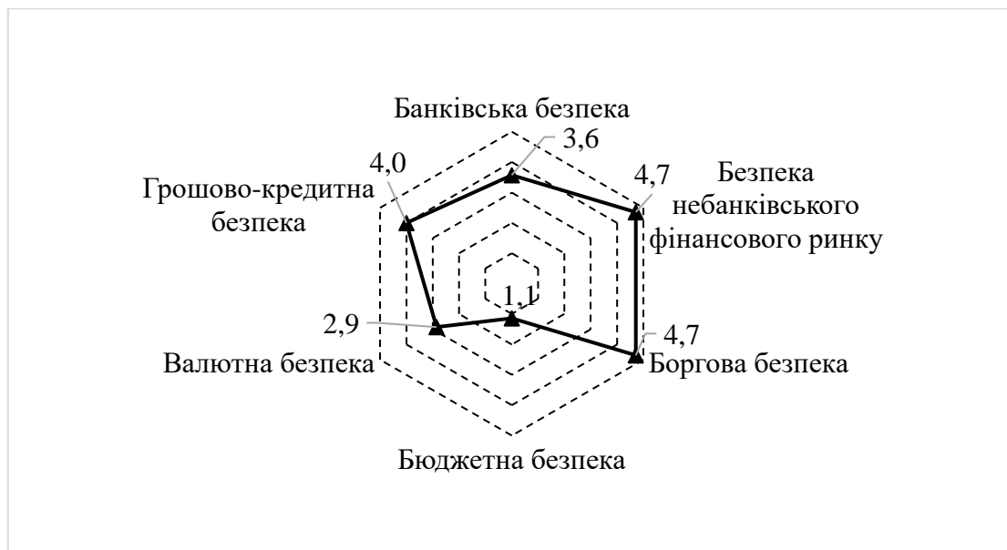
Рисунок 3 – Значення субіндексів фінансової безпеки держави за рангами

Ранжування субіндексів фінансової безпеки від 1 (максимально прийнятний рівень) до 6 (мінімально прийнятний рівень) і визначення середнього значення за сім років дозволили стверджувати, що досить позитивна тенденція притаманна показникам «бюджетної безпеки», про що свідчить ранг у 1,1 пункту (рис. 3). Отже, держава здійснює досить виважену політику перерозподілу ВВП та фінансування дефіциту бюджету. Водночас такі показники, як «боргова безпека» та «безпека небанківського фінансового ринку» містяться на одній позиції, але значення в 4,7 пункту свідчить про досить високий рівень боргового навантаження на економіку України та низький рівень розвитку фінансових посередників, які виконують свої функції як акумулятор фінансових ресурсів на незадовільному рівні.